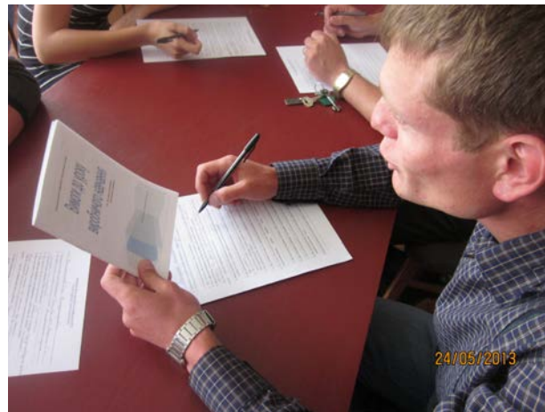
Засідання школи молодого педагога