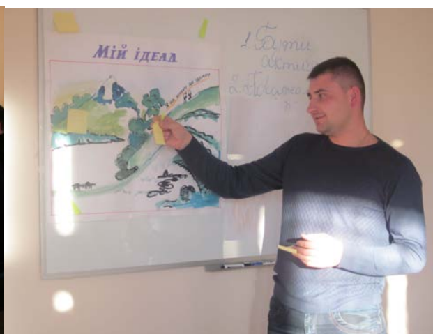
Робота практичного психолога з використанням тренінгових вправ